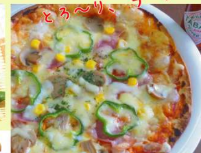
ミックスピッツァ ¥680