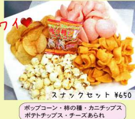
スナックセット ¥650 ポップコーン・柿の種・カニチップス・ポテトチップス・チーズあられ