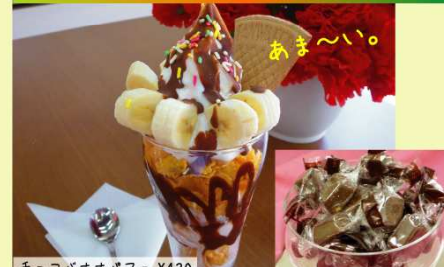
チョコバナナパフェ ¥420