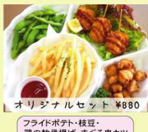
オリジナルセット ¥880 フライドポテト・枝豆・鶏の軟骨揚げ・まぐろ串カツ