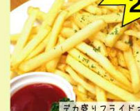
デカ盛りフライドポテト ¥620