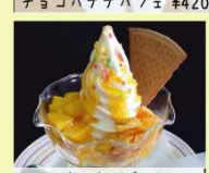
マンゴーサンデー ¥380