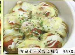
マヨチーズたこ焼き ¥480