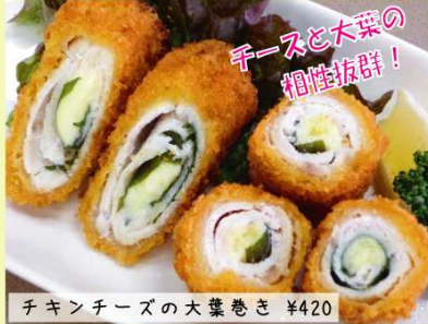
チキンチーズの大葉巻き ¥420