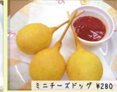
ミニチーズドッグ ¥280