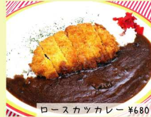
ロースカツカレー ¥680