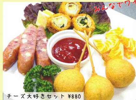
チーズ大好きセット ¥880 チキンチーズ大葉巻き・チーズ入りフランク・ミニチーズドッグ・プロセスマーブルチーズ