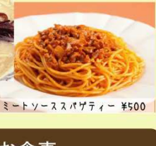
ミートソーススパゲティ ¥500