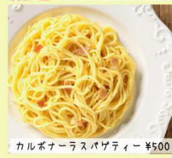
カルボナーラスパゲティ ¥500