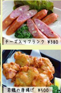
チーズ入りフランク ¥380