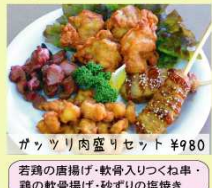
ガンバリ肉盛りセット ¥980 若鶏の唐揚げ・軟骨入りつくね串・鶏の軟骨揚げ・砂ずりの塩焼き