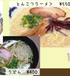
とんこつラーメン ¥550