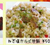
ねぎ塩カルビ炒飯 ¥500